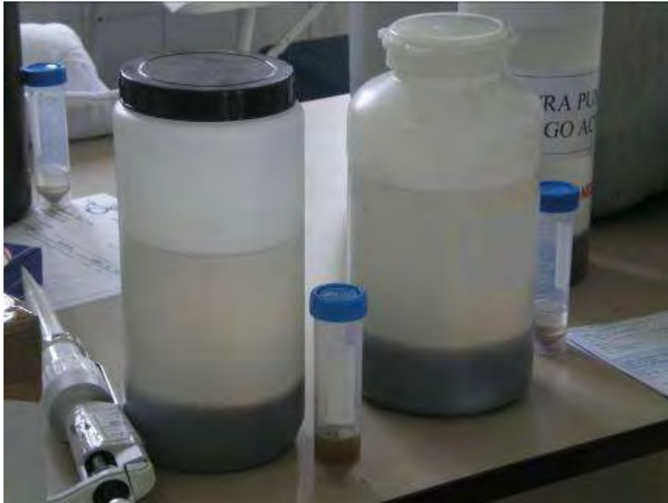
Figura 1. Muestras preparadas para ser enviadas.

Los participantes envían a las instalaciones de GBS los sistemas de contención de muestras refrigeradas, incluyendo: frasco de plástico de 2 L de cierre hermético vacío, placas refrigerantes y material de relleno de la muestra para evitar movimientos bruscos. Dicho envío debe hacerse en la modalidad de “envío con retorno”, de modo que en el mismo momento en el que la nevera llega a GBS, es completada con las muestras anteriormente definidas y de nuevo entregada a la misma mensajería de modo que se garantice la entrega en destino, como muy tarde, al siguiente día de la toma de muestra, evitando así alteraciones de las misma.