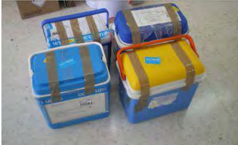
Figura 2. Momento del proceso de distribución de muestras.

industrial. En cualquier caso todas las muestras ocuparán aproximadamente dos tercios de la capacidad del frasco, de forma que quede una cámara de aire a fin de evitar la anoxia durante el transporte de las muestras. Igualmente todos los frascos estarán rotuladas con el código de participante, el tipo de muestra y la fecha de envasado de la misma.